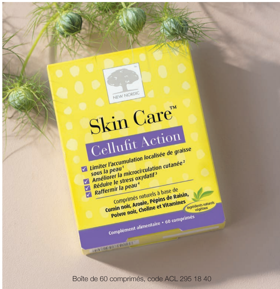
Boîte de 60 comprimés, code ACL 295 18 40

Ne pas dépasser la dose journalière recommandée. Un complément alimentaire ne remplace pas une alimentation variée et équilibrée et un mode de vie sain. Ne pas utiliser chez l'enfant, l'adolescent, ni chez la femme enceinte ou en période d'allaitement. Si vous prenez des médicaments demandez l'avis de votre médecin. À tenir hors de la portée des jeunes enfants.