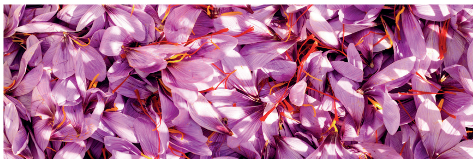
Safran ( Crocus sativus )

Anxiété, surmenage... de nombreuses personnes sont en situation de mal-être psychologique, que ce soit pour des raisons personnelles, familiales ou professionnelles.